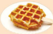
Waffel am Stiel mit oder ohne Puderzucker