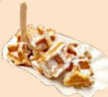
Waffel Konfekt mit oder ohne Puderzucker